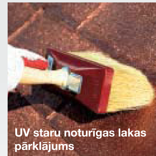
UV staru noturīgas lakas pārklājums