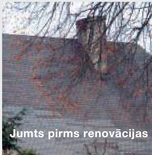
Jumts pirms renovācijas