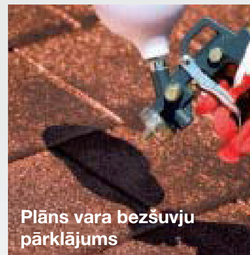
Plāns vara bezšuvju pārklājums